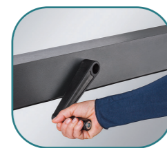
MANIGLIA REMOVIBILE La maniglia consente senza sforzo di alzare ed abbassare la parte superiore del paravento a proprio piacimento.

Tutti i dettagli sono stati studiati per migliorare confort ed esperienza di utilizzo, con soluzioni pensate per conferire al dehor accorgimenti di natura funzionale e di stile.