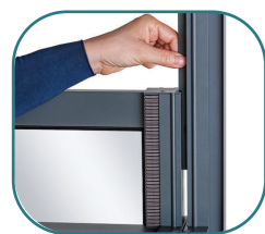
KIT PARASPIFFERI La finestra è fornita con un kit paraspifferi pensato per creare un ambiente isolato sia per il freddo che per il caldo.

Il dehor modello ELITE è fornito di finestre con tecnologia saliscendi disponibili in diverse misure, con la possibilità di raggiungere i 290 cm di larghezza.