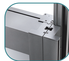
GIUNZIONE PANNELLI La giunzione ideata per i pannelli lineari disegnata a coda di rondine per conferire stabilità e sicurezza.